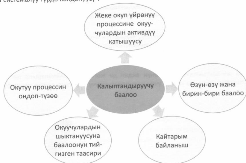
Схема 1. Компоненты формативного оценивания

Калыптандыруучу баалоо – бул мугалимдин күнүмдүк ишинде 5 компонентти пландуу жана системалуу түрдө колдонуусу 2 :