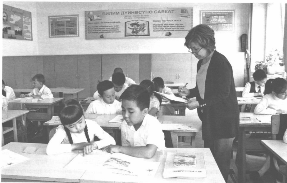
Келгиле, окуйбүз! Калыптандыруучу баалоо

Баалоо ишмердүүлүгүнө болгон негизги талаптардын бири – бул окуучулардын өз натыйжаларын баалоо, каталарын байкоо жана түрдүү иштерге карата коюлган талаптарды билүү жөндөмдүүлүгүн калыптандыруу. Бул максатка жетүү үчүн өзүн-өзү жана бирин-бири баалоо ыкмаларын колдонуу шарт.